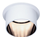
☞ White/Black matt

incl. 1×6 W, Coin 470 lm, 2.700 K EAN 4000870 933763 933.76