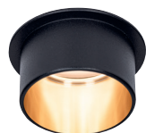
☞ Black/Gold matt

incl. 1×6 W, Coin 470 lm, 2.700 K EAN 4000870 933763 933.76