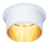
☞ White/Gold matt

incl. 1×6 W, Coin 470 lm, 2.700 K EAN 4000870 933787 933.78